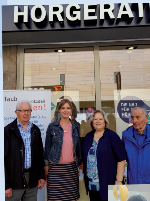
CI-Tag 2017 bei Hörgeräte KIND