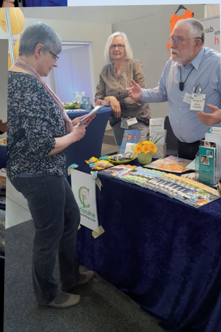
Unser Stand auf der REHAB in Karlsruhe