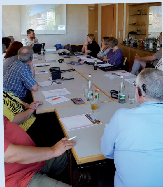
CIV-BaWü: SHG-Leitertreffen und Vorstandschaft