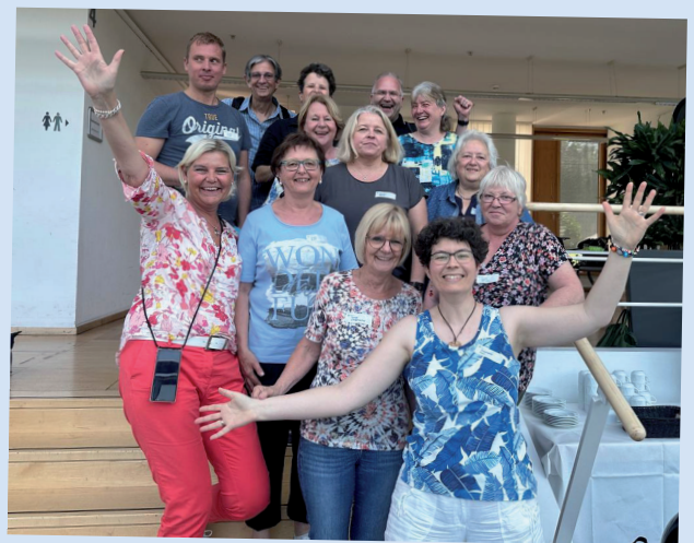
Die Mitglieder des CIV-BaWü bei der DCIG-Fachtagung Gelsenkirchen