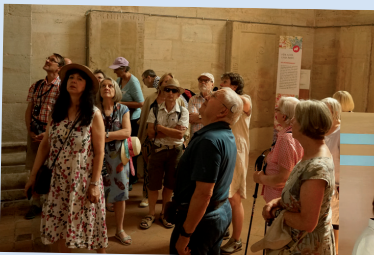
Hörtraining während wir auf den Spuren der Stauer wandeln