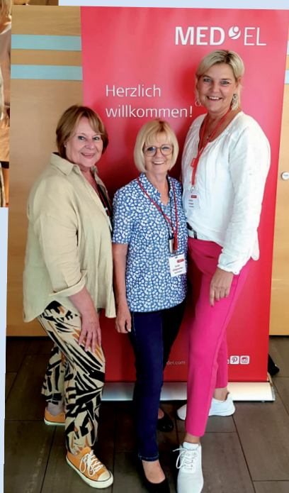
Beim MED-EL Technikworkshop für SHG-LeiterInnen

Fröhlich war die Stimmung auf dem Jubiläumsfest zum 30-jährigen Bestehen der SHG Stuttgart am 23. September.