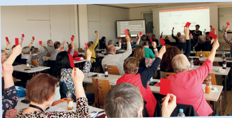
Hier wird dem Vorstand die rote Karte gezeigt – was aber hier positiv ist: einstimmige Entlastung!