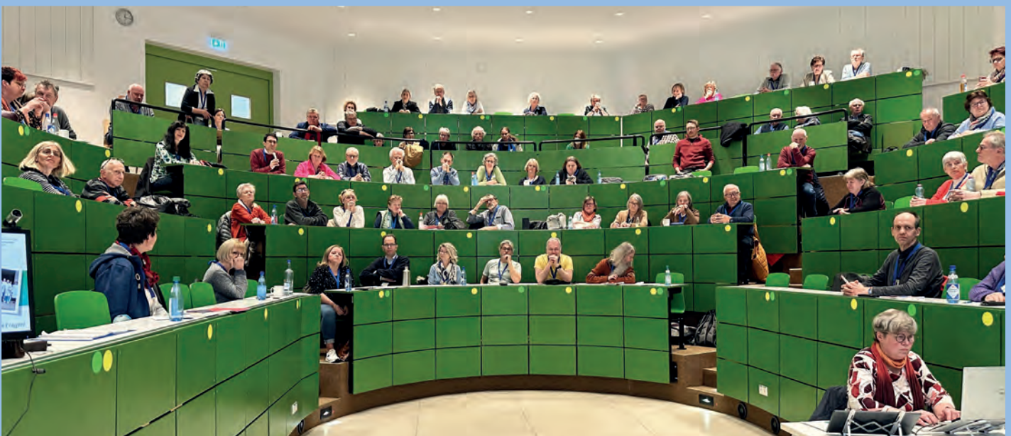
Volles Haus bei der Mitgliederversammlung des CIV-BaWü