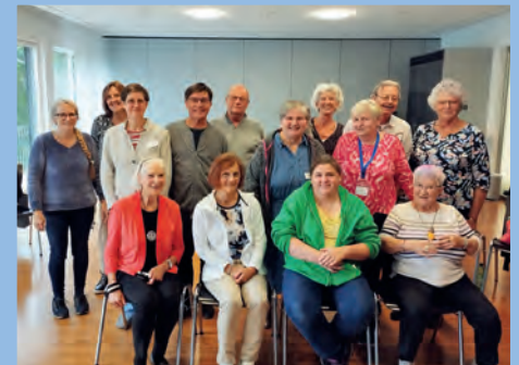
Frohe Gesichter beim Seminar mit JOMI

Am 11. April trafen wir uns zum Stammtisch im Gasthaus Küssabergblick in Lauchringen zum gemeinsamen Austausch. Leider mussten wir feststellen, dass der Raum eine schlechte Hörakustik aufwies.