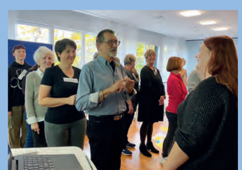
Ich spreche mit den Händen – verstehst du mich?