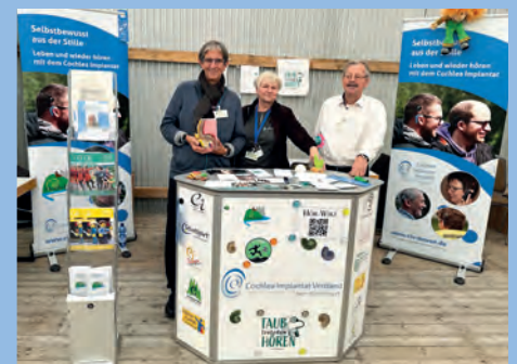
Unser Stand bei der Hochrhein-Messe