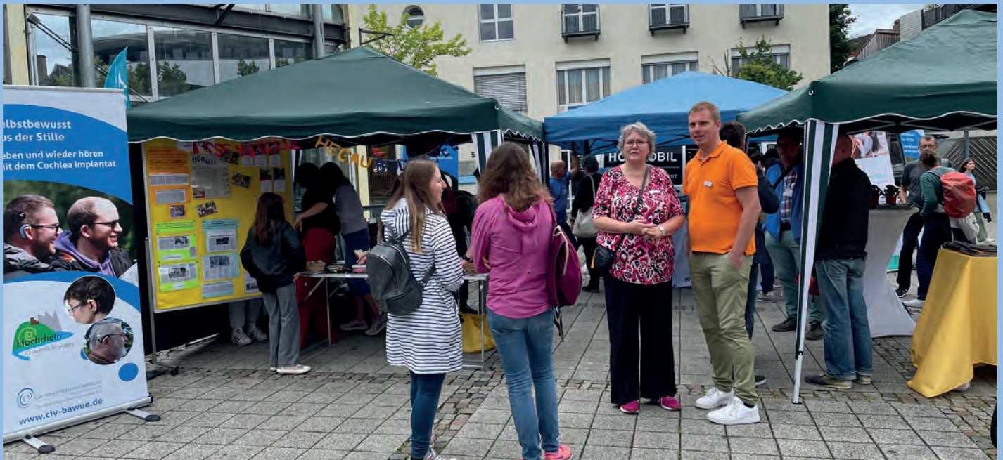
Wir lassen uns beim CI-Aktionstag in Konstanz – trotz Regens – die gute Laune nicht verderben

Mit Hörakustikern und Selbsthilfegruppen war das Hörmobil im Rahmen des CI-Aktionstags am 21. Juni in Konstanz in der Fußgängerzone. Ein Informationstag rund ums Hören war das Thema dieser Veranstaltung, an der auch die SHG Hochrhein mit ihrem Stand teilnahm. Einige Besucher kamen zu uns, um sich über das CI, die Operation und das Hören damit zu informieren. Leider war es an diesem Tag in Konstanz sehr windig und regnerisch.