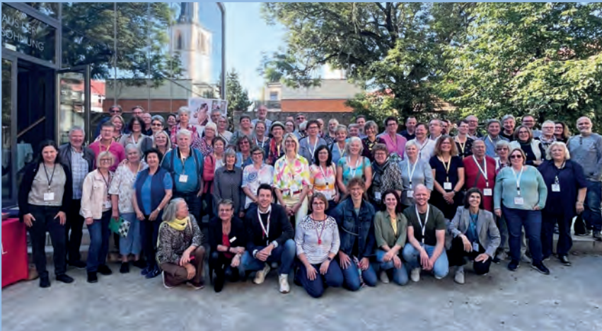
So viele TeilnehmerInnen in Erfurt – beeindruckend