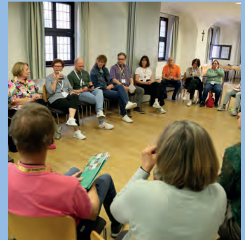
Gruppenarbeit bei den SHG-Leitern in Erfurt

Ein weiteres Highlight in diesem Jahr war das Pantomime-Seminar mit JOMI , einem erfolgreichen Künstler und selbst CI-Träger. Am Samstag, dem 28. September, bewegten sich alle Teilnehmer unter JOMIs Anleitung mithilfe der Körpersprache, um ohne Worte, nur mit Gestik und Mimik, zu kommunizieren. Mit Einzel- und Gruppenrollenspielen wurde der Tag aktiv, informativ und auch lustig gestaltet. Ebenso lernten wir, welche Signale unser Körper unbewusst aussendet.