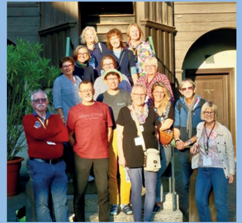
Die Baden-Württemberger in Erfurt