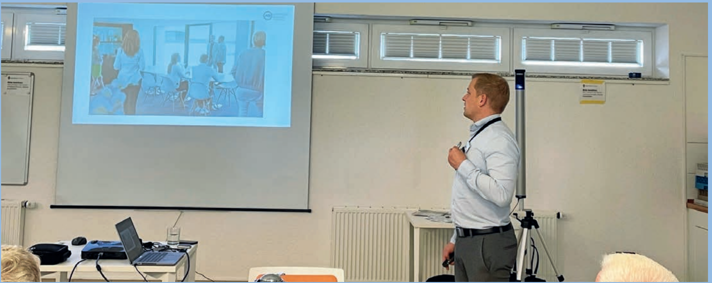
Digitalisierung bei Advanced Bionics

überaus gut besucht. Der Vortrag wurde interaktiv durchgeführt und somit konnten gleich die vielen Fragen dazu beantwortet werden.