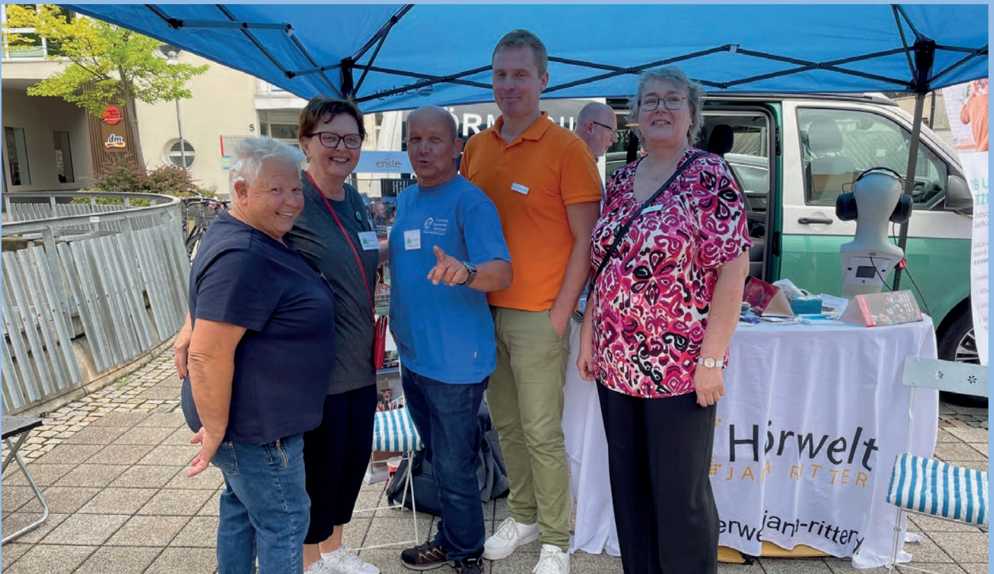
Das Schwarzwälder Team und das Team von Hörakustik Enste