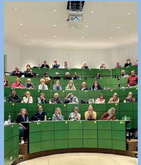
Volles Haus bei der Mitgliederversammlung

Herzlich bedanken möchte ich mich bei der Vorstandschaft des CIV-BaWü für die Unterstützung und Organisation der Seminare und beim Redaktionsteam des CIV-BaWü für die Erstellung des CIVrund-Heftes.