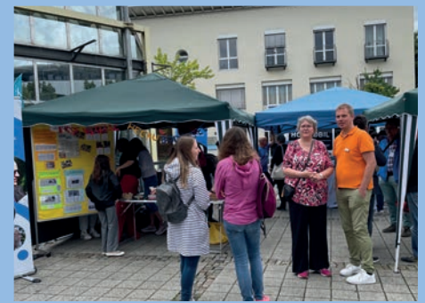
Regen? Egal – wir haben trotzdem gute Laune