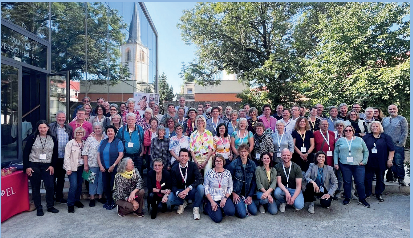
SHG-LeiterInnen und Engagierte aus ganz Deutschland treffen sich in Erfurt