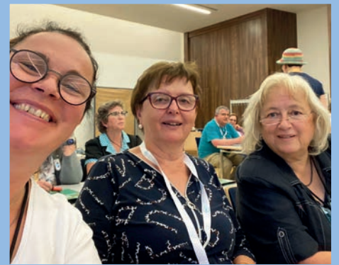
Auf der SHG-Leiter-Tagung in Erfurt