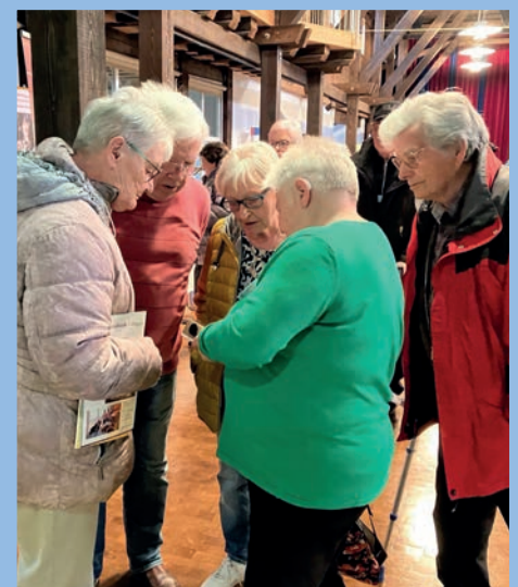
Mithilfe des Ohr-Dummys wird das Cochlea Implantat erklärt