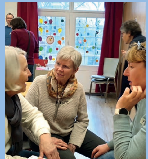
So sieht „a schwäbisches Schwätzle“ aus