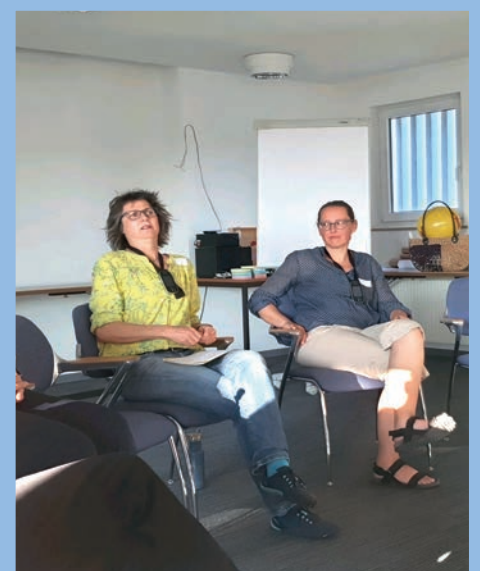
Die Klinikclowns stellen sich vor