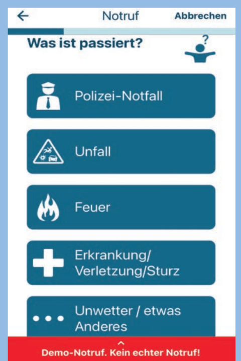
So sieht ein Notruf über „nora“ aus