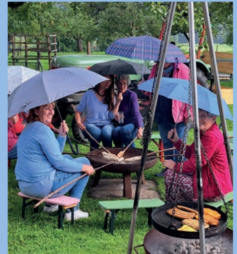
Gemeinsam grillen im Regen macht Spaß

Einige neue Mitglieder kontaktieren uns per Mail, weil sie Informationen oder eine Beratung über das Cochlea Implantat erhalten möchten, oft stehen sie vor der OP.