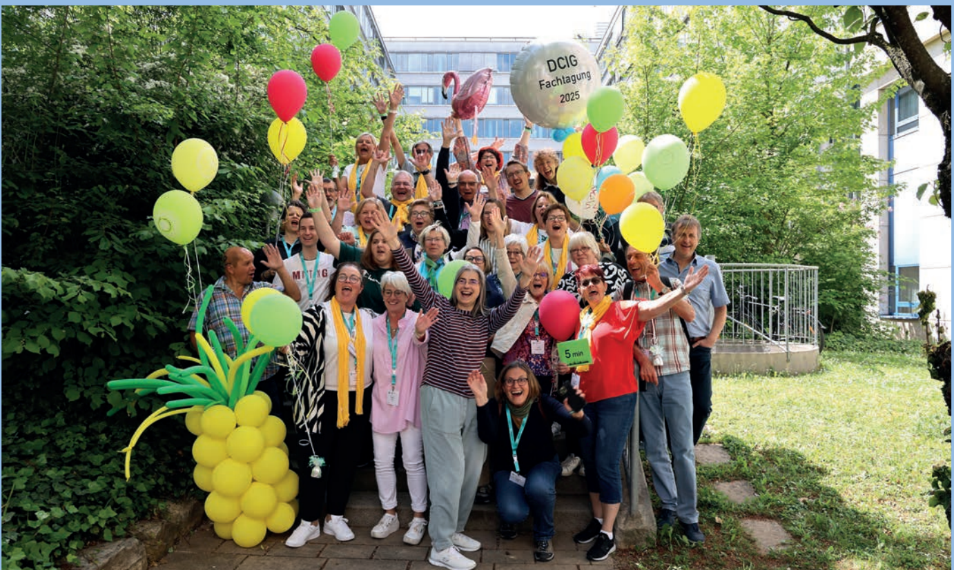
Teamwork: Gemeinsam feiern wir die Fachtagung