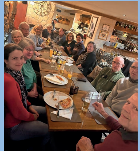
Stammtisch: Austausch, Beratung und Hörtraining