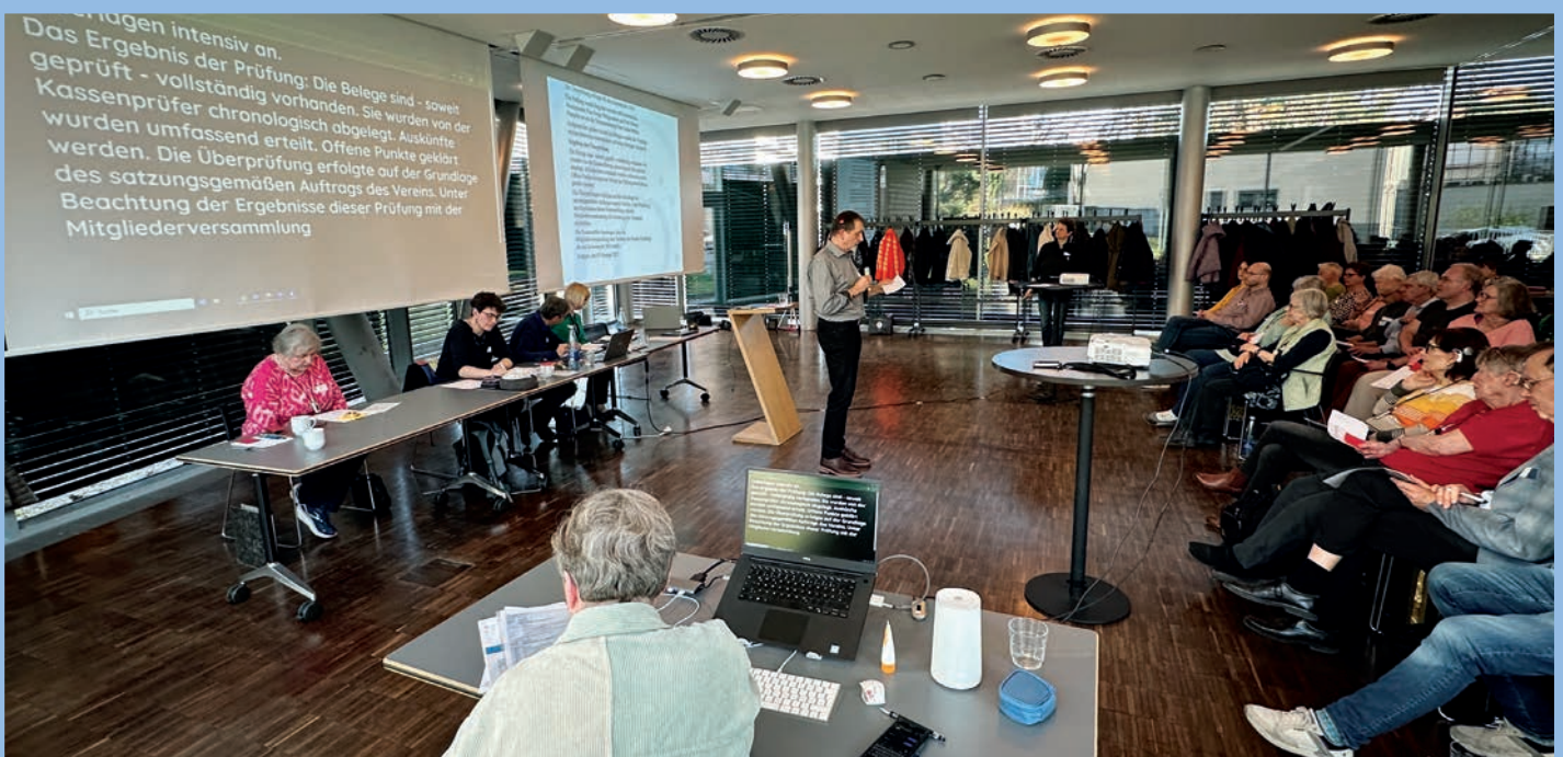
Mitgliederversammlung: Vortrag mit Schriftdolmetschung