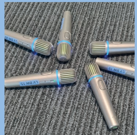
Ein „Hör-Stern“ aus Pass-arounds