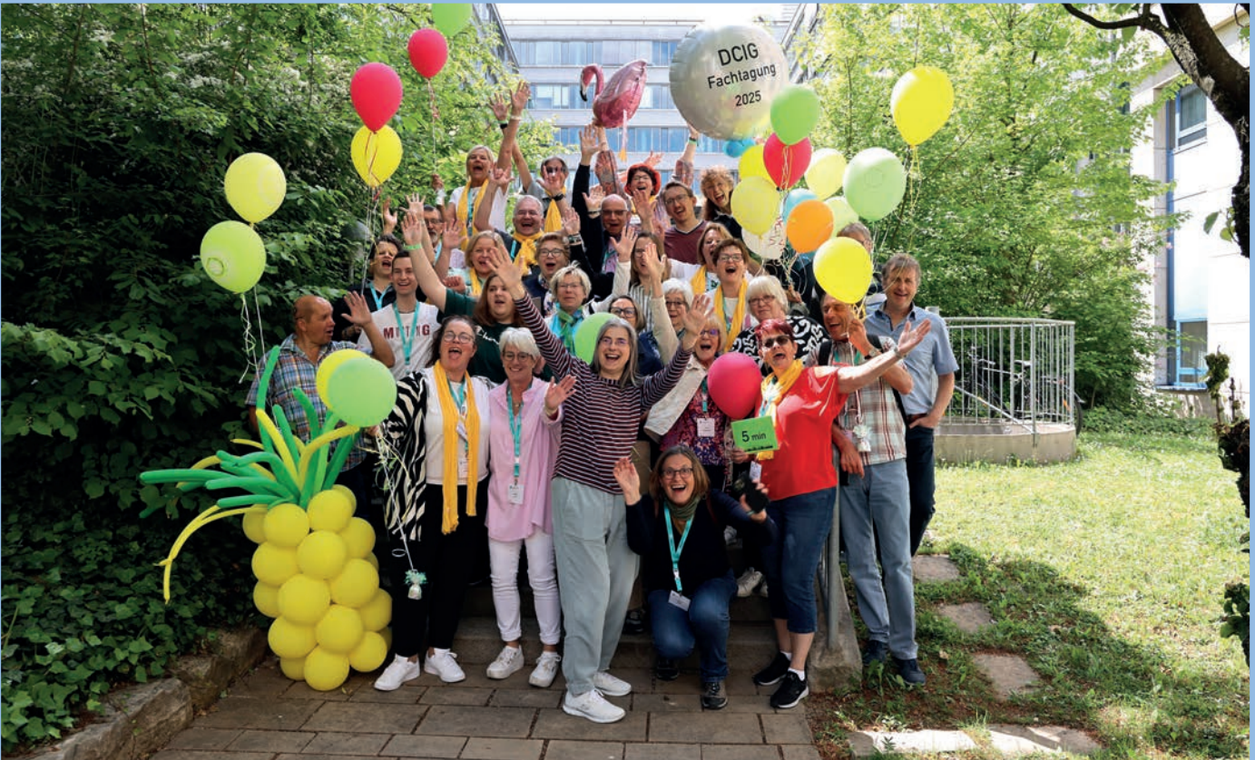
Teamwork: Gemeinsam feiern wir die Fachtagung

Von meinem HNO-Arzt aus Überlingen erfuhr ich, dass er schon so drei oder vier Anwärter:innen für ein CI unter seinen Patienten hat. Seine Hinweise fruchten da wohl nicht so. Wir alle können uns vorstellen, woran das liegt. Wenn es ihm gelingt, diese Patient:innen zu einem kleinen Gruppentreffen in seiner Praxis zu bitten, darf ich dann von meinen Erfahrungen erzählen und Fragen beantworten.