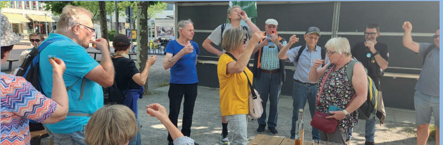
Sind alle angekommen? Willkommen am Bodensee

Im zweiten Jahr unseres Bestehens 2025 waren wir insofern erfolgreich, als doch stetig neue Interessenten zu uns stoßen und einige davon auch bleiben! Wir sind eine sehr kommunikative Gruppe geworden. Leider fehlt uns immer noch ein passender Raum, in dem wir bei den Treffen auch mal ein wenig „arbeiten“ können. Eine Viertelstunde Gebärden üben z. B. oder mal Referenten einladen. Wir hoffen sehr, dass wir 2026 einen passenden Raum finden. Andere Gruppen kennen das Problem im ländlichen Raum auch: Nicht jeder hat ein Auto, also sollten die Treffpunkte gut mit den Öffentlichen erreichbar sein.