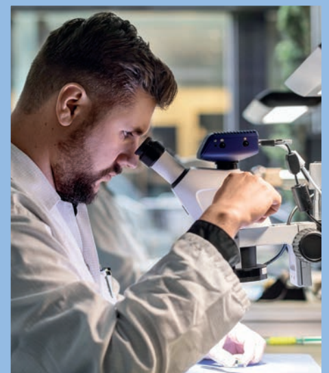
Filigrane Feinarbeit: Produktion bei MED-EL