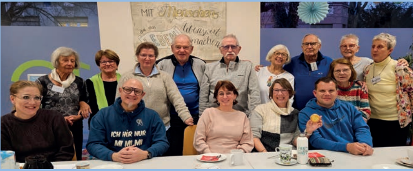
Das sind wir von der SHG Hegau-Bodensee

Erfreulicherweise bekamen wir auf Antrag in 2025 die Gelder für eine Funkanlage ! Damit üben wir noch ;- ) Und wir bedanken uns ganz herzlich bei der „Regionalen Fördergemeinschaft Hochrhein-Bodensee in Kornwestheim“, die uns diese Anschaffung so früh nach unserem Gruppenstart möglich gemacht hat!