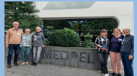
Zu Gast bei MED-EL in Innsbruck

Und im September dann unser kleiner Urlaub im Leutaschtal in Österreich. Hier schlossen sich noch ein paar Leute aus der Bodensee-Oberschwaben-SHG an. Wir verbrachten vom 10.–14.09. schöne Tage im Leutaschtal, am 11.09. war der Höhepunkt unserer Reise: die Besichtigung von MED-EL in Innsbruck! Wie sich später herausstellte, war unsere Führerin die gleiche, die uns fast auf