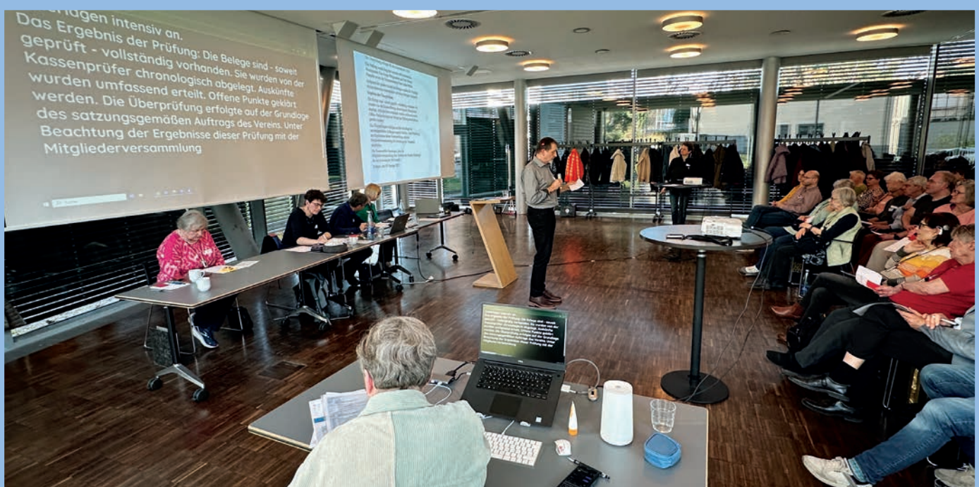
Mitgliederversammlung: Vortrag mit Schriftdolmetschung